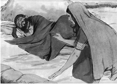
Lût i ηa’si ndzisi i nyiηi (3.7)

5 Nàwumì nîn bè tēyn nô mi ilvi gha, Lût i bèynsì ki sî ηweyn na, “Mi n-ndù nî ki ta wà bè.” 6 Lût nîn kali meyn alè’ ghè a ghi n-lej asaη ateyn i ndu ni ki ta nà lum nì ηweyn nì bè.